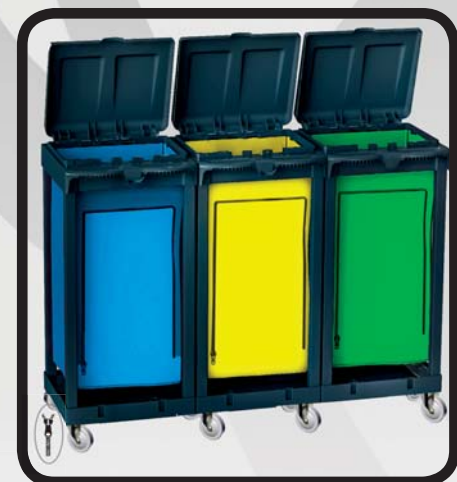
PORTABOLSAS TRIPLE CON SACOS EcoLytec STAFF BESAIDE