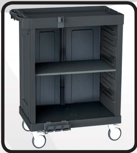
CARRO HABITACIONES EcoLytec STAFF CON BALDA DE MADERA PAS

Código: 10002071 Ref.: H501WA Embalaje: 1