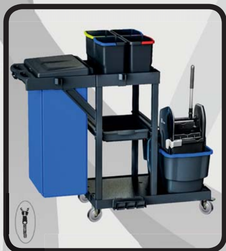
CARRO LIMPIEZA COMPLETO EcoLytec STAFF PEÑALARA