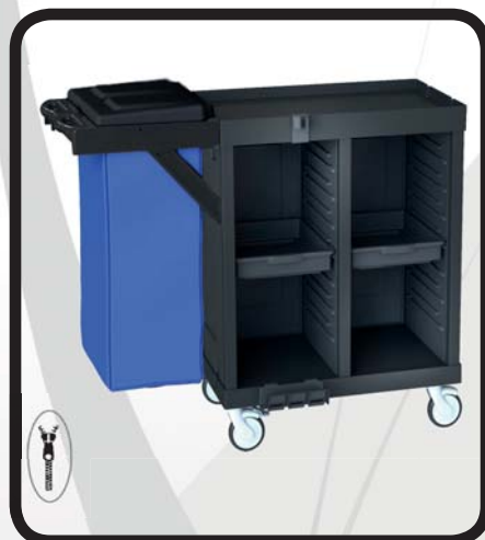
CARRO HABITACIONES EcoLytec STAFF CON 2 BANDEJAS DE PLÁSTICO Y SACO BAZTÁN

Código: 10002021 Ref.: H1102A Embalaje: 1