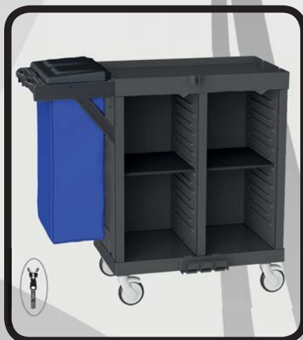
CARRO HABITACIONES EcoLytec STAFF CON 2 BALDAS DE MADERA Y SACO JERTE

Código: 10002051 Ref.: H1102WA Embalaje: 1