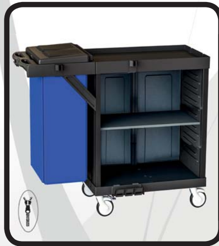
CARRO HABITACIONES EcoLytec STAFF CON BALDA DE MADERA Y SACO ORDESA

Código: 10002081 Ref.: H1101WA Embalaje: 1