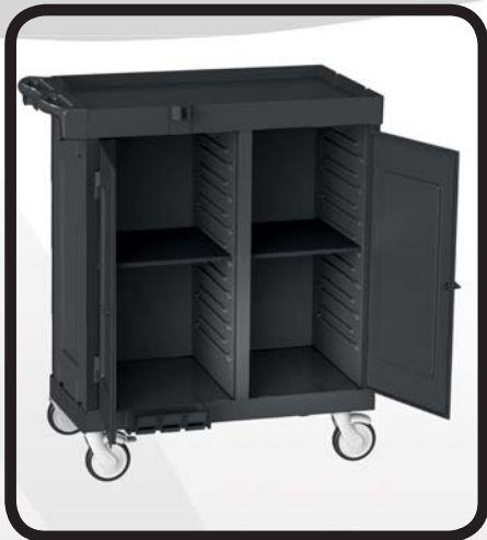
CARRO HABITACIONES CERRADO EcoLytec STAFF CON 2 BANDEJAS DE PLÁSTICO EZCARAY

Código: 10002141 Ref.: H502WDA Embalaje: 1