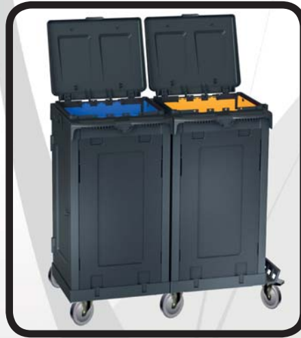
PORTABOLSAS DOBLE CERRADO CON SACOS EcoLytec STAFF MENDAUR

Código: 10002331 Ref.: W099D Embalaje: 1