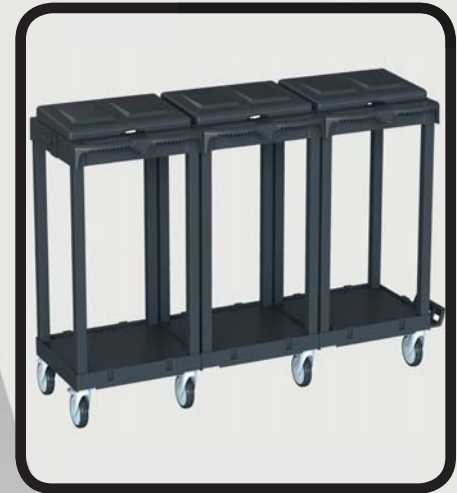
PORTABOLSAS TRIPLE EcoLytec STAFF ANAYET

Código: 10002271 Ref.: H099-1 Embalaje: 1