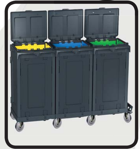
PORTABOLSAS TRIPLE CERRADO CON SACOS EcoLytec STAFF LARRÚN

Código: 10002341 Ref.: W390D Embalaje: 1