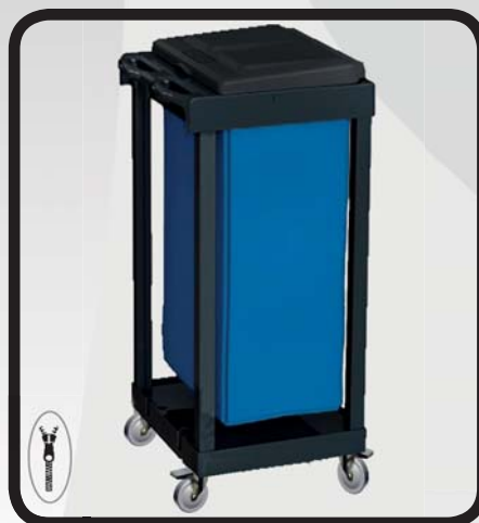
PORTABOLSAS CON SACO EcoLytec STAFF URGULL

Código: 10002281 Ref.: W390-1 Embalaje: 1