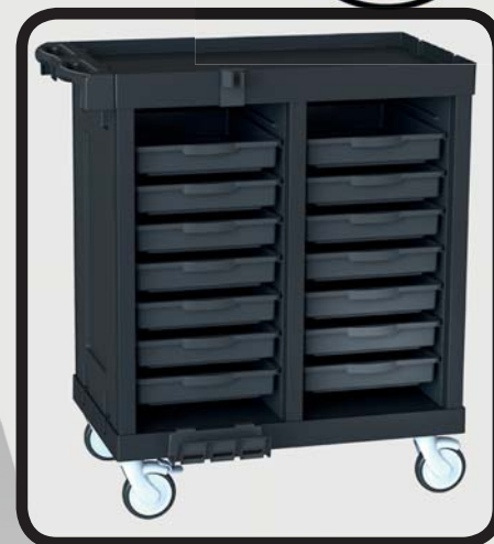
CARRO ALMACENAJE EcoLytec STAFF ALLOZ