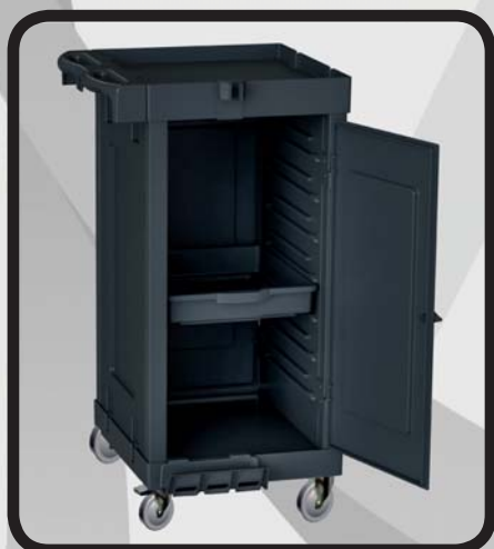
CARRO CERRADO ALMACENAJE EcoLytec STAFF IRATI

Código: 10002351 Ref.: M041B2D Embalaje: 1