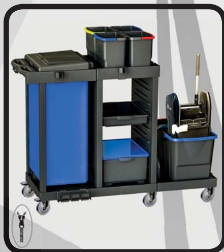
CARRO LIMPIEZA COMPLETO EcoLytec STAFF MONCAYO

Código: 10002221 Ref.: C451SBT Embalaje: 1