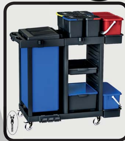
CARRO LIMPIEZA COMPLETO EcoLytec STAFF CAZORLA

Código: 10002231 Ref.: C111SKY2BT Embalaje: 1