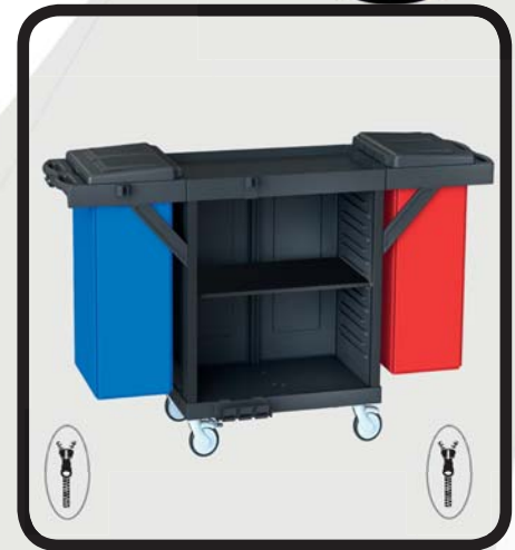
CARRO HABITACIONES EcoLytec STAFF CON BALDA DE MADERA Y 2 SACOS BENASQUE

Código: 10002091 Ref.: H1501WA Embalaje: 1