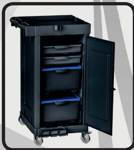
CARRO ALMACENAJE EcoLytec STAFF YESA