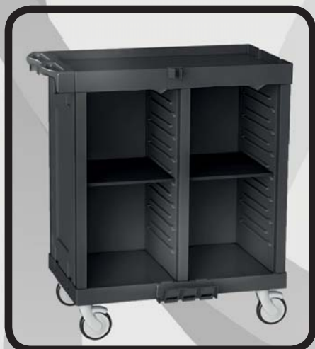
CARRO HABITACIONES EcoLytec STAFF CON 2 BALDAS DE MADERA ARÁN

Código: 10002041 Ref.: H502WA Embalaje: 1