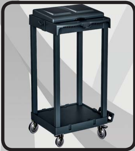
PORTABOLSAS EcoLytec STAFF IGUELDO

Código: 10002261 Ref.: H090-1 Embalaje: 1