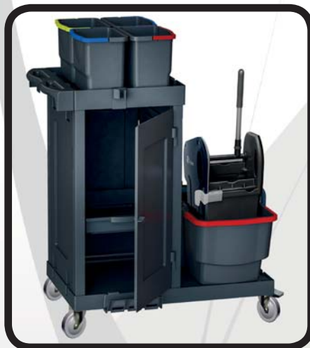
CARRO CERRADO LIMPIEZA EcoLytec STAFF UNZUÉ

Código: 10002391 Ref.: C241D Embalaje: 1