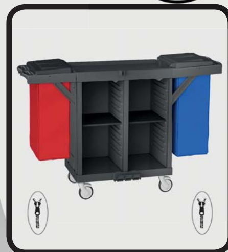
CARRO HABITACIONES EcoLytec STAFF CON 2 BALDAS DE MADERA Y 2 SACOS SIL

Código: 10002061 Ref.: H1502WA Embalaje: 1