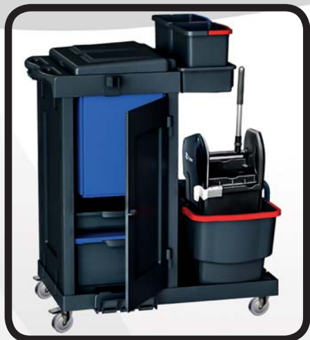
CARRO CERRADO LIMPIEZA EcoLytec STAFF URBIÓN

Código: 10002401 Ref.: C041 DBTYCY Embalaje: 1