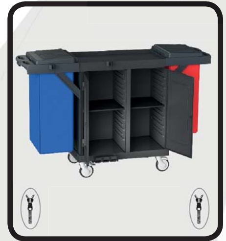
CARRO HABITACIONES CERRADO EcoLytec STAFF CON 2 BALDAS DE MADERA Y 2 SACOS COVADONGA

Código: 10002161 Ref.: H1502WDA Embalaje: 1