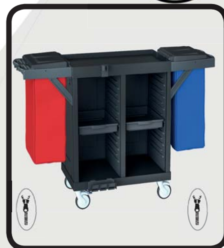
CARRO HABITACIONES EcoLytec STAFF CON 2 BANDEJAS DE PLÁSTICO Y 2 SACOS SALAZAR

Código: 10002031 Ref.: H1502A Embalaje: 1