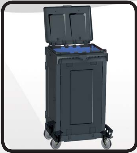
PORTABOLSAS CERRADO CON SACO EcoLytec STAFF SAIOA

Código: 10002321 Ref.: W090D Embalaje: 1