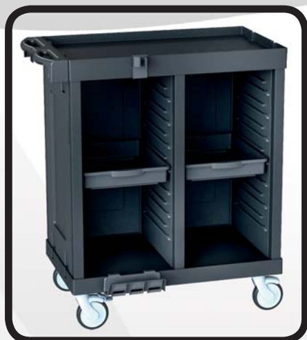
CARRO HABITACIONES EcoLytec STAFF CON 2 BANDEJAS DE PLÁSTICO RONCAL

Código: 10002011 Ref.: H502A Embalaje: 1