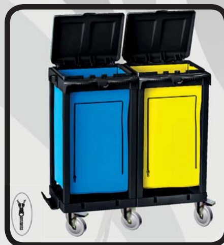
PORTABOLSAS DOBLE CON SACOS EcoLytec STAFF AMBOTO