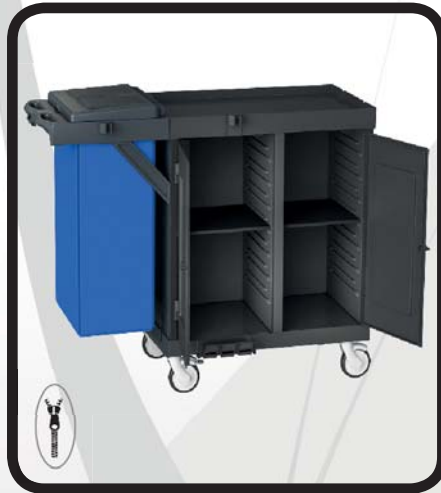
CARRO HABITACIONES CERRADO EcoLytec STAFF CON 2 BALDAS DE MADERA Y SACO ULZAMA

Código: 10002151 Ref.: H1102WDA Embalaje: 1