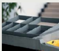
Accesorio opcional: 68000661. Clasificador carro de habitaciones.

En estos carros se pueden colocar hasta 7 baldas. Como ejemplo, el carro de estas fotos están configurados con 2 baldas.