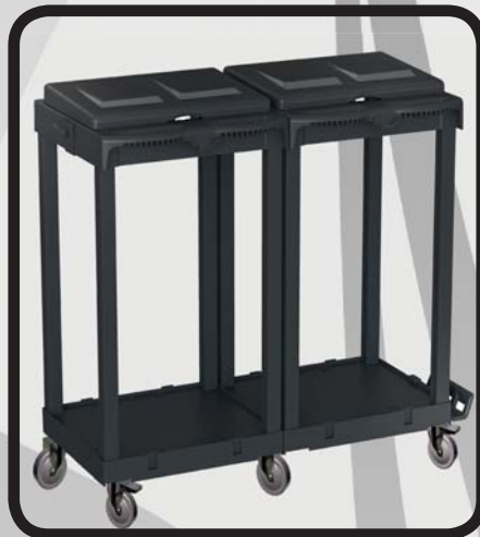
PORTABOLSAS DOBLE EcoLytec STAFF GORBEIA

Código: 10002261 Ref.: H090-1 Embalaje: 1