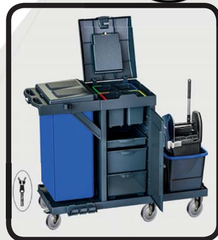
CARRO CERRADO LIMPIEZA EcoLytec STAFF MALADETA

Código: 10002451 Ref.: C471DBY Embalaje: 1